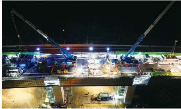
床版取替状況(境谷橋)

阪和自動車道阪南IC～和歌山IC間は、1974年(昭和49年)の開通から約50年が経過し、老朽化も進んでいます。そこで、阪和道をはじめ関西エリアで既設橋梁を撤去し、新たに橋梁を架け替える抜本的なリニューアル工事を進行しています。今まで以上に耐久性のある高速道路に進化させ、100年先の安全・安心な高速道路をかたちにし、さらなる快適な移動時間の提供を目指していきます。みなさまのご理解、ご協力をお願いします。