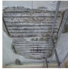
境谷橋 床版下面コンクリートの変状状況

阪和自動車道阪南IC～和歌山IC間は、1974年(昭和49年)の開通から50年が経過しています。当該区間の橋梁は、コンクリートの材料として用いる骨材にやむなく海砂を使用したことで、塩害による著しい損傷が発生しています。また、モータリゼーションの発展に伴い大型車の交通量が増加するとともに、規制緩和により車両の総重量が増加する傾向にあり、過酷な環境に置かれています。これまでも定期的に点検を行いながら部分的な補修・補強を繰り返してきましたが、構造物の長期的な安全性や耐久性の確保が困難になりつつあります。そこで、既設橋梁を撤去し、新たに橋梁を架け替える抜本的なリニューアル工事を行うことにより、これまでより耐久性のある安全・安心な道路へと生まれ変わります。