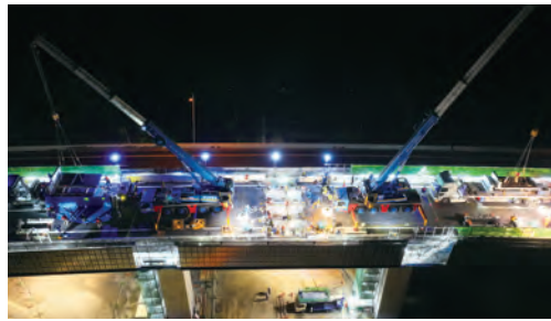
床版取替状況(境谷橋)

橋やトンネル、のり面などの道路構造物を対象に、長期的な安全性や耐久性を確保することを目的として、耐久性に優れた部材への取り替えや補強などを大規模に行います。橋桁や床版など路面を支える主要な部材を取り替える際は、これまでの工事よりも長期間、大規模な交通規制が必要になる場合があります。