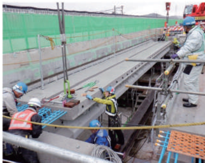
コンクリート桁の架設状況