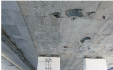
松島高架橋 床版下面 コンクリートの剥離

阪和自動車道 和歌山北IC～和歌山南SIC間は、1974年(昭和49年)の開通から約50年が経過しています。当該区間の橋梁は、コンクリートの材料として用いる骨材にやむなく海砂を使用したことで、塩害による著しい損傷が発生しています。また、モータリゼーションの発展に伴い大型車の交通量が増加するとともに、規制緩和により車両の総重量が増加する傾向にあり、過酷な環境に置かれています。これまでも定期的に点検を行いながら部分的な補修・補強を繰り返してきましたが、構造物の長期的な安全性や耐久性の確保が困難になりつつあります。そこで、既設橋を撤去し、新たに橋を架け替える抜本的なリニューアル工事を行うことにより、これまでより耐久性のある安全・安心な道路へと生まれ変わります。